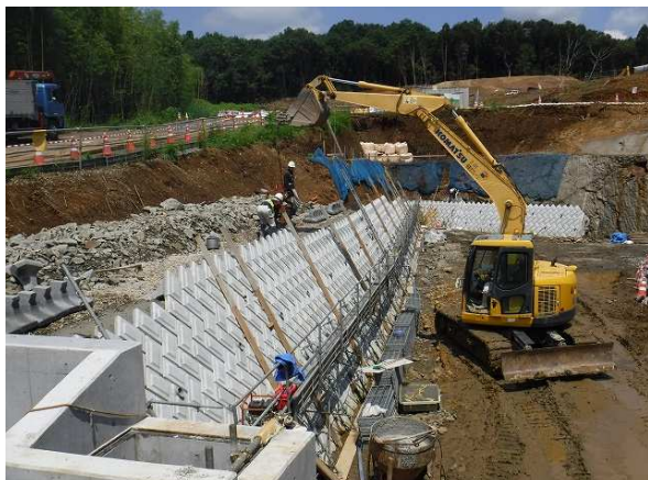
南側調整池（ブロック積）