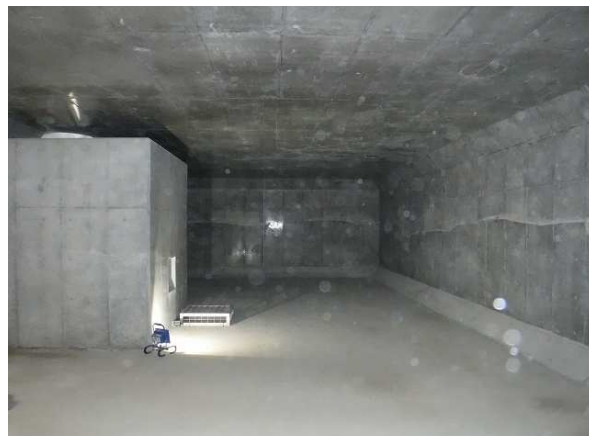
北側調整池（埋設構造物内部）