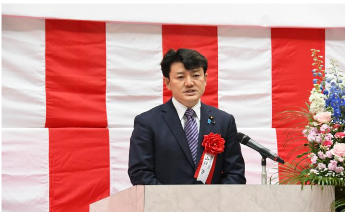
【来賓祝辞】 衆議院議員 山口 晋 様