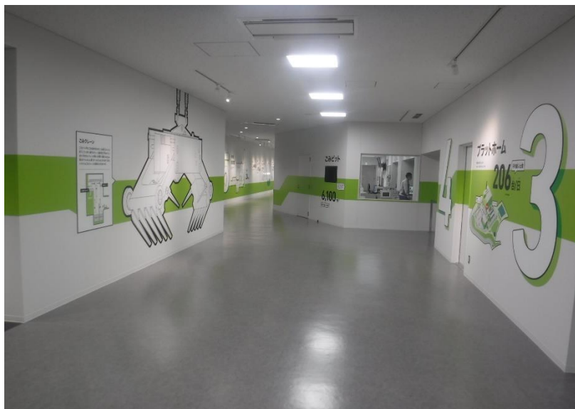
●工場棟 見学エリア施工状況