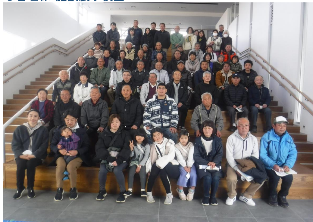
●近隣住民向け現場視察（令和5年2月12日）