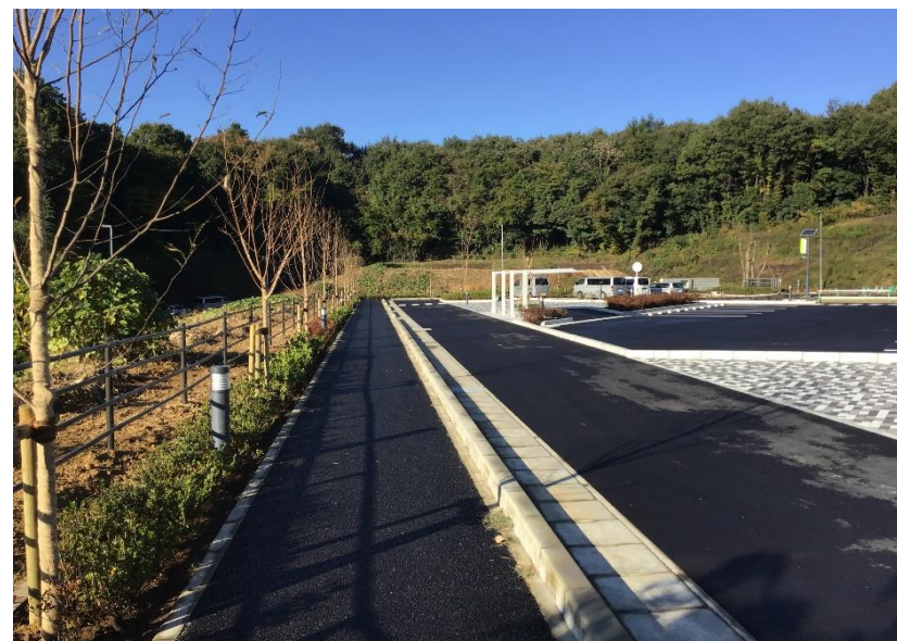
● 場内植栽施工状況