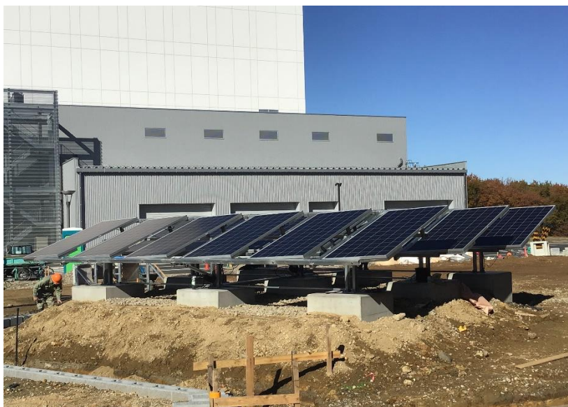
● 『エコの広場』 ソーラーパネル施工状況