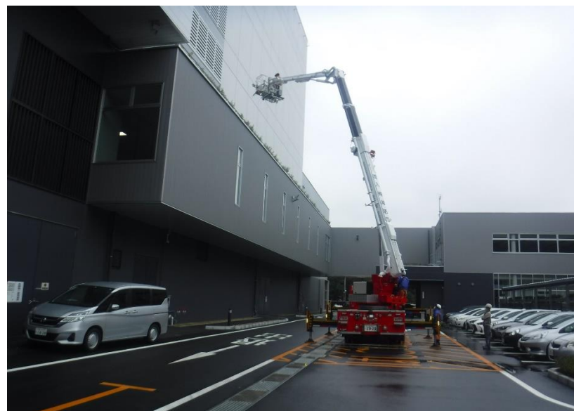
● 緊急時に備えた消防による確認検査状況