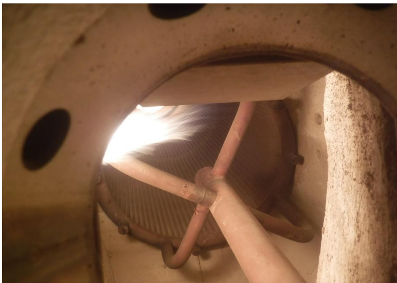
● 焼却炉内乾燥焚き実施状況