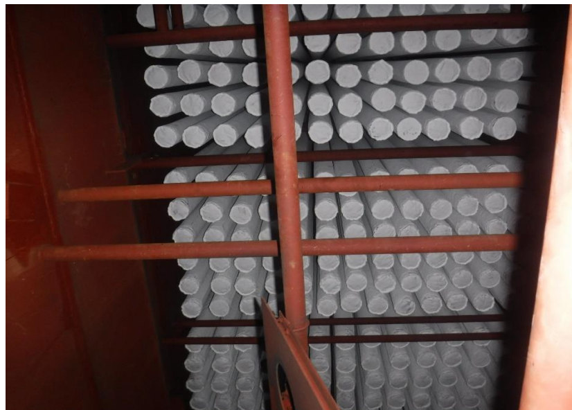
● ろ過式集じん器ろ布設置状況