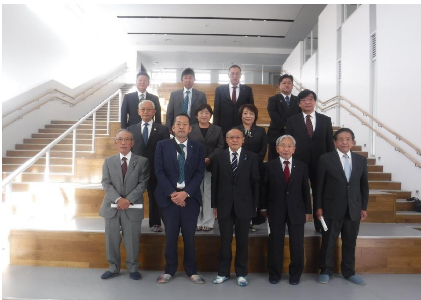
● 毛呂山町議会議員視察（令和4年11月10日）