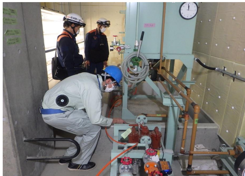
●1工区 灯油配管耐圧試験実施状況