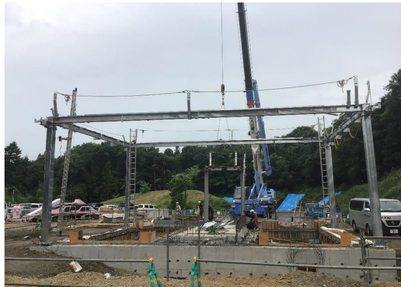
●計量棟 鉄骨建方状況