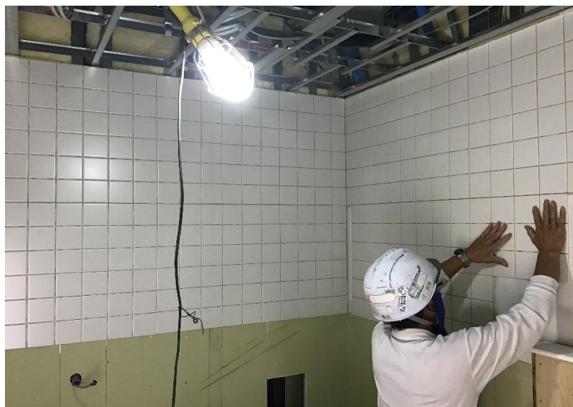
●管理棟 外部トイレ壁タイル貼状況