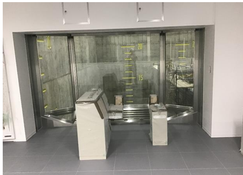
●2工区 ごみクレーン操作盤設置状況