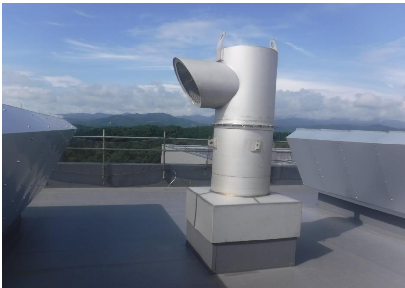
●1工区 炉室屋根防水施工状況