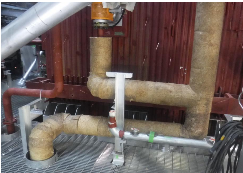
●1工区 ボイラ配管保温施工状況