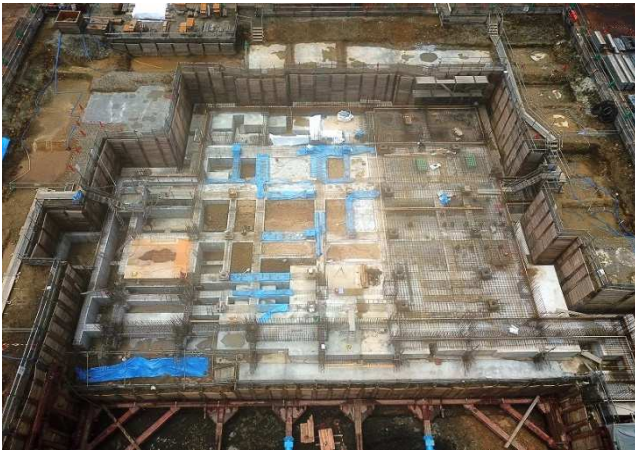
1工区：埋め戻し／スラブ配筋(炉室部分)